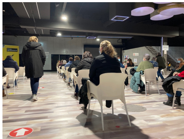
Bijna geen stoel is onbezet in de wachtruimtes. Op een korte stop van 10 minuten op vrijdagavond na, liep het prikken in de tientallen 'kamers' continu door